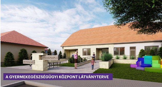
A GYERMEKEGÉSZSÉGÜGYI KÖZPONT LÁTVÁNYTERVE