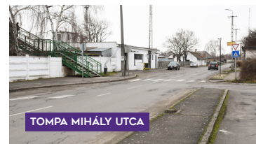
TOMPA MIHÁLY UTCA