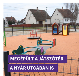
MEGÉPÜLT A JÁTSZÓTÉR A NYÁR UTCÁBAN IS