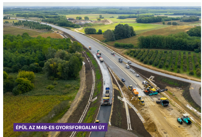
ÉPÜL AZ M49-ES GYORSFORGALMI ÚT

Az M49-es gyorsforgalmi út valóban régóta szerepel a térség terveiben. Több korábbi országgyűlési képviselő szájából hangzott el ígéretként, de ma már nem ígéret, hanem megvalósuló beruházás. Az első ütem hamarosan elkészül, a folytatás pedig az országhatárig biztosít majd korszerű kapcsolatot. Ez nem múltidézés kérdése, hanem jövőépítés. A beruházás tehermentesíti a 49-es főutat, csökkenti az átmenő forgalmat, és új gazdasági lehetőségeket teremt Mátészalka számára. Egy ilyen