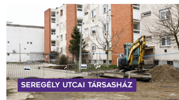
SEREGÉLY UTCAI TÁRSASHÁZ