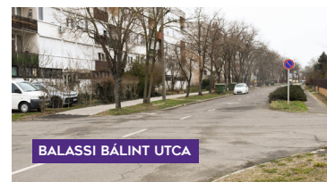
BALASSI BÁLINT UTCA

A fejlesztések Mátészalka Város Önkormányzatának önerőből megvalósuló beruházásaként is folytatódnak. Megújul a Balassi Bálint utca , a Zrínyi utca és Zrínyi köz közötti szakasz korszerű aszfaltburkolattal, új szegélyezéssel és szintbe emelt aknafedlapokkal. A Hajdú utcában közel 370 méteren történik felújítás, a társasházak előtti járdák rendezésével és hulladékgyűjtő helyek kialakításával. A Seregély utcai tömbbelső rekonstrukciója új közlekedőfelületeket és 11 térközburkolatú parkolót eredményez a csapadékvízrendszer kiépítésével együtt. A Tompa Mihály utcában teljes burkolatcsere valósul meg alépítmény-megerősítéssel, csapadékvíz-elvezetéssel, járdafelújítással és új fasor telepítésével a vasúti terület mentén. Ezek a fejlesztések együtt rajzolnak ki egy hosszú távú, tudatos városképet, olyan közlekedési és közösségi tereket, amelyek nemcsak áteresztik a forgalmat, hanem szolgálják az itt élők mindennapjait – biztonságosabban, rendezettebben, fenntarthatóbb módon.