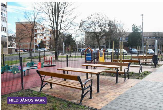
HILD JÁNOS PARK