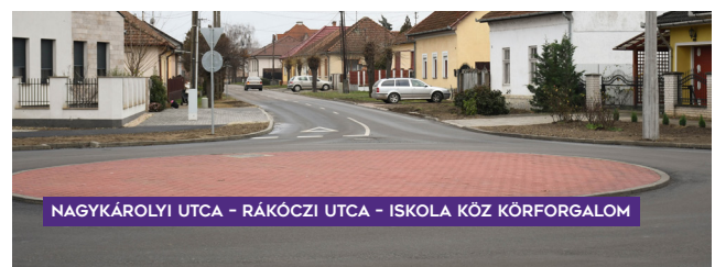
NAGYKÁROLYI UTCA - RÁKÓCZI UTCA - ISKOLA KÖZ KÖRFORGALOM