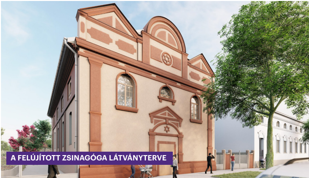
A FELÚJÍTOTT ZSINAGÓGA LÁTVÁNYTERVE

fejlesztés évtizedekre meghatározza a térség versenyképességét.