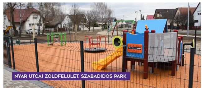
NYÁR UTCAI ZÖLDFELÜLET, SZABADIDŐS PARK