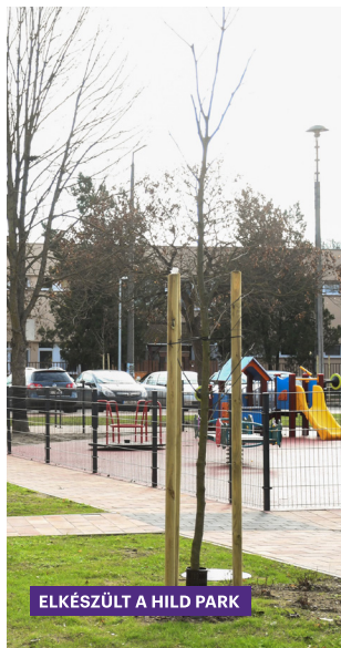
ELKÉSZÜLT A HILD PARK

A fejlesztések folyamatos egyeztetések eredményei. A városvezetéssel, az intézményekkel és a civil közösségekkel való párbeszéd garantálja, hogy a beruházások valódi igényekre válaszoljanak. Fontos, hogy a döntések mögött helyi tapasztalat és közös gondolkodás álljon, hiszen a város jövőjét együtt formáljuk. Így minden megújuló utca, intézmény vagy közösségi tér egy-egy közösen kimondott szükségletből születik meg.